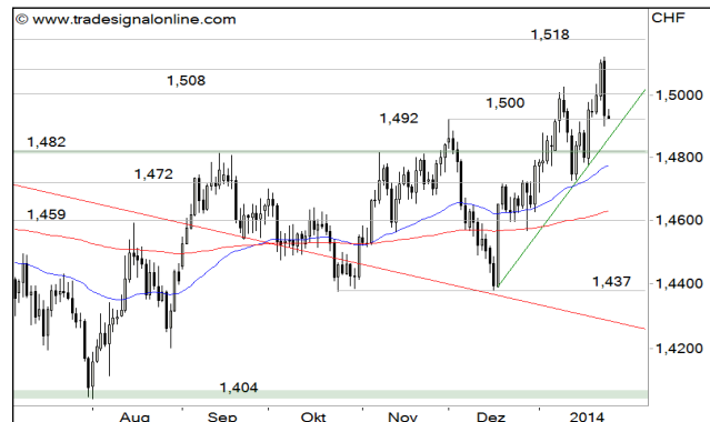
GBP/CHF – 6-Monats-Chart

Stand 24.01.2014, 7:00 Uhr; Quelle: BörseGo AG