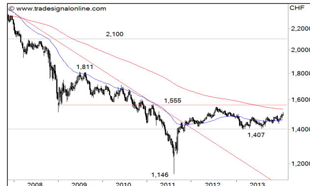
GBP/CHF – 5-Jahres-Chart