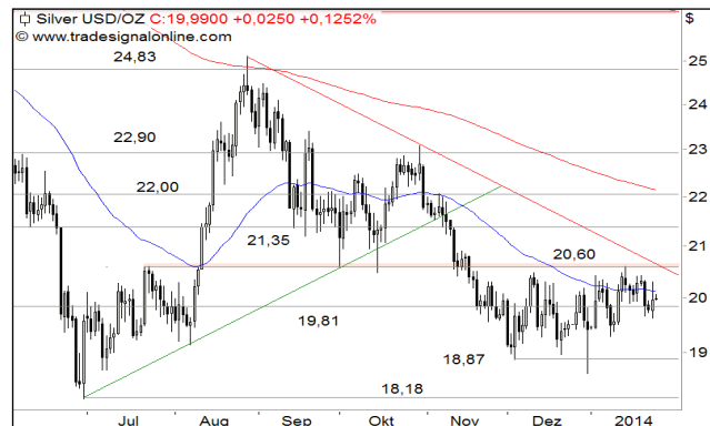
Silber – 6-Monats-Chart

Stand 24.01.2014, 7:00 Uhr