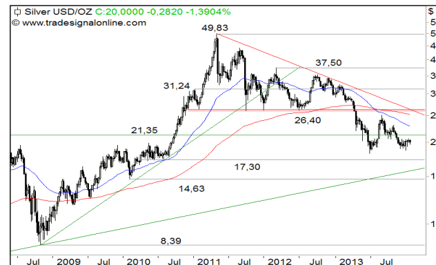
Silber – 5-Jahres-Chart